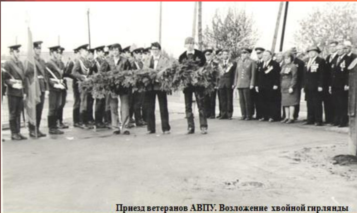
Приезд ветеранов АВТУ. Возложение хвойной гирлянды к памятной стеле 370- стрелковой дивизии. 1985 год